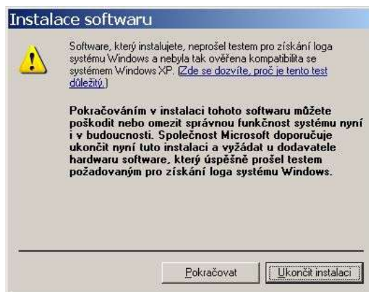
Figure 3: Software not tested by Microsoft

The default values of the variables in programming are a technical necessity. They are also a means of influencing the user. Many applications use them deliberately. In Internet Explorer 6.0 and in higher versions the location of the various options is contained in the Internet Options dialog box. Automatically option is set to IE