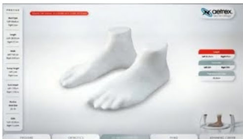
Digitální dvojče nohou